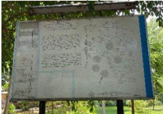
Gambar 6. Denah taman yang tidak dapat dibaca

mengatasi masalah saat ini dan apakah output yang dihasilkan cukup untuk mencapai efek yang diinginkan. Pada evaluasi pemanfaatan ruang terbuka hijau Taman Tanjung Puri yaitu ketersediaan fasilitas pada Taman Tanjung Puri tidak memiliki fasilitas yang memadai. Hal ini terlihat dari fasilitas bermain anak yang rusak dan tanaman yang tidak terawat. Kapasitas layanan Taman Tanjung Puri juga tidak dapat menyediakan layanan yang memadai. Hal ini ditunjukkan oleh pengunjung yang susah dalam mendapatkan informasi di taman seperti denah atau aturan yang ada di taman.