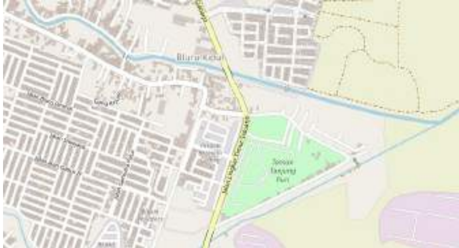
Gambar 2. Peta Tanjung Puri Kecamatan Sidoarjo Kabupaten Sidoarjo