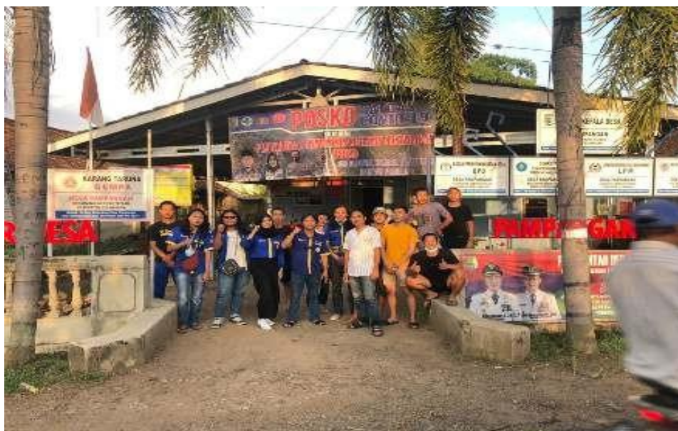
Gambar 3. Foto Bersama Peserta Pemanfaatan Limbah Fly-Ash Untuk Campuran Bata di Desa Umbul Lumus Kecamatan Marga Punduh Kabupaten Pesawaran

Secara keseluruhan, program ini menjadi bukti nyata bahwa pendekatan pemberdayaan berbasis komunitas mampu menghasilkan transformasi sosial yang signifikan. Dinamika proses pendampingan yang melibatkan berbagai pihak, serta fokus pada pemanfaatan sumber daya lokal secara berkelanjutan, telah menciptakan dampak positif yang tidak hanya dirasakan oleh masyarakat Desa Umbul Lumus, tetapi juga memberikan inspirasi bagi komunitas lainnya. Program ini diharapkan dapat terus berkembang dan menjadi model pemberdayaan masyarakat di daerah lain.