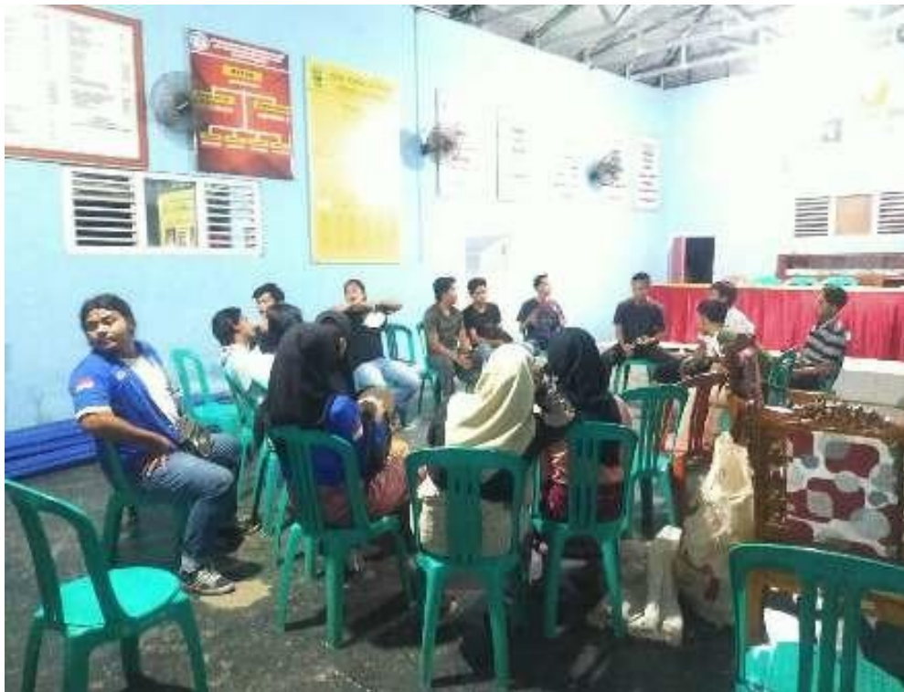
Gambar 2. Penyuluhan Pemanfaatan Limbah Fly-Ash

Keberhasilan program ini tidak hanya terlihat dari aspek teknis, seperti kualitas batu bata berbasis fly ash yang dihasilkan, tetapi juga dari perubahan sosial yang muncul dalam komunitas. Masyarakat mulai menunjukkan pola pikir yang lebih terbuka terhadap inovasi, dengan meningkatnya minat untuk terus belajar dan berinovasi. Selain itu, munculnya pemimpin lokal dari kalangan peserta pelatihan memperlihatkan bahwa program ini berhasil menciptakan agen perubahan di tingkat komunitas, yang menjadi motor penggerak bagi keberlanjutan inisiatif ini.