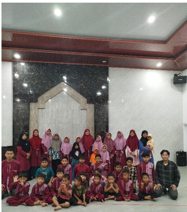
Gambar 2. Antusias Santri

Pengabdian masyarakat yang dilakukan di TPA Masjid Al-Azhar ini berfokus pada upaya peningkatan kehadiran santri melalui sistem pemberian reward. Berdasarkan hasil pelaksanaan program selama tiga bulan, terlihat adanya peningkatan signifikan dalam kehadiran santri dari 60% menjadi 85%. Reward yang diberikan berupa hadiah kecil, penghargaan verbal, sertifikat, dan kesempatan istimewa dalam kegiatan TPA, terbukti mampu memotivasi santri untuk lebih disiplin dan aktif mengikuti kegiatan.