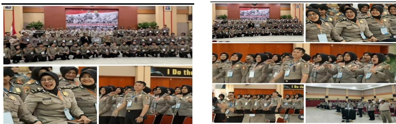
Gambar 2. Foto bersama Peserta dalam mengikuti Diklat Public Speaking yang diikuti oleh Tenaga Kependidikan Sepolwan dan Taruni sebanyak 130 Peserta.